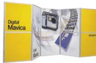
Basiskit 10 10 panelen van 1000x1000 mm. Totaalformaat: 2000x5000 mm