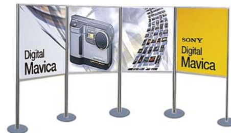
Expo opstelling paneelformaat 1000x1250 mm Totaal hoogte 2000 mm

Voor uitgebreide overzicht los leverbare onderdelen en standaard maten, zie onze website.