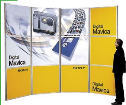
Basiskit 12 12 panelen van 1000x1000 mm. Totaalformaat: 3000x4000 mm

U kunt beginnen met een basis kit maar ook kleiner opstelling en deze later uitbreiden tot een complete stand. Het systeem bestaat uit buizen die in elke lengte zijn te koppelen en panelen die in elke gewenste maat kunnen worden geleverd. De panelen zijn zeer solide maar toch uitzonderlijk licht uitgevoerd en worden, zonder gebruik van gereedschap, met speciale clips aan de aluminium buizen gekoppeld. Halogeen spotjes zorgen voor de uitlichting van uw boodschap. Panelen en buizen zijn in optionele sterke waterdichte tassen te vervoeren. Voor uitgebreide opstellingen zijn ook flyghtcases leverbaar.