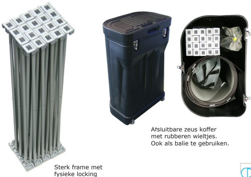
Afsluitbare zeus koffer met rubberen wielletjes. Ook als balie te gebruiken.